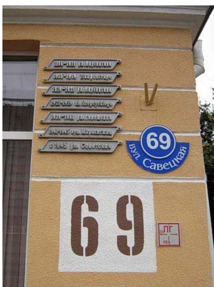
2. Баранавічы. Вуліца Савецкая, на якой размешчаны шылды з гістарычнымі назвамі вуліцы ў розныя перыяды часу: Марыінская, Шэптыцкага і інш.