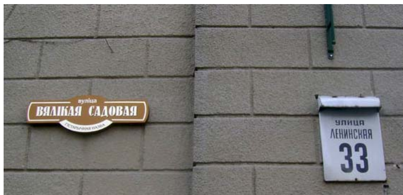
1. Магілёў. Вуліца Ленінская, на якой размешчаны шылды з гістарычнай назвай вуліцы «Вялікая Садовая»