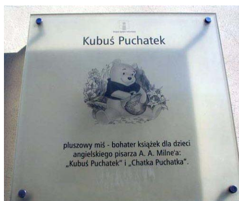
3. Варшава. Шылда на вуліцы Віні-Пуха.